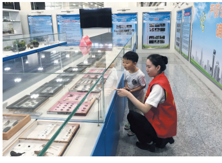
皇岗海关关员借助国门生物安全陈列室向小朋友普及生物安全法规