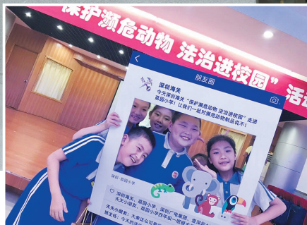
深圳海关组织开展“保护濒危物种 法治进校园”活动并进行网络直播