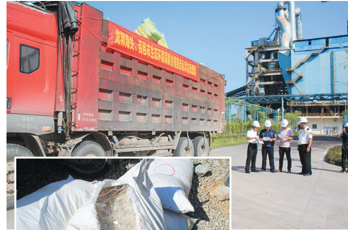
全程监督“洋垃圾”装车转运

近日,龙邦海关联合百色市生态环境局在百色关区具备处置资质企业,对查获的走私废旧衣物一批26.15吨、废塑料一批0.66吨,共计26.81吨“洋垃圾”进行无害化处理,并邀环保部门共同监督处置。