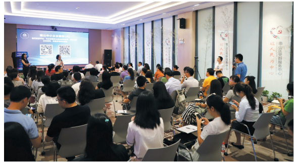
前海海关联合南山区街道举办企管政策宣讲会