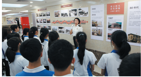
罗湖海关与翠园中学开展暑期实践活动,组织文明创建参观、法律培训和现场学习。