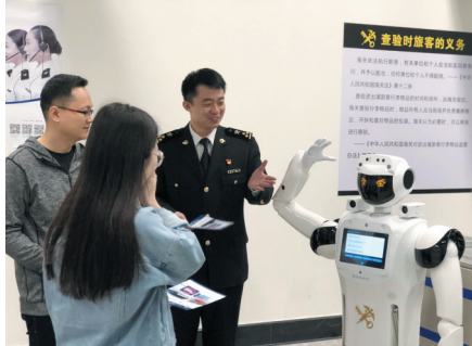
西九龙站口岸来了“智能关员”