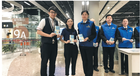
西九龙站海关关员向港铁公司工作人员普及进出境法律法规