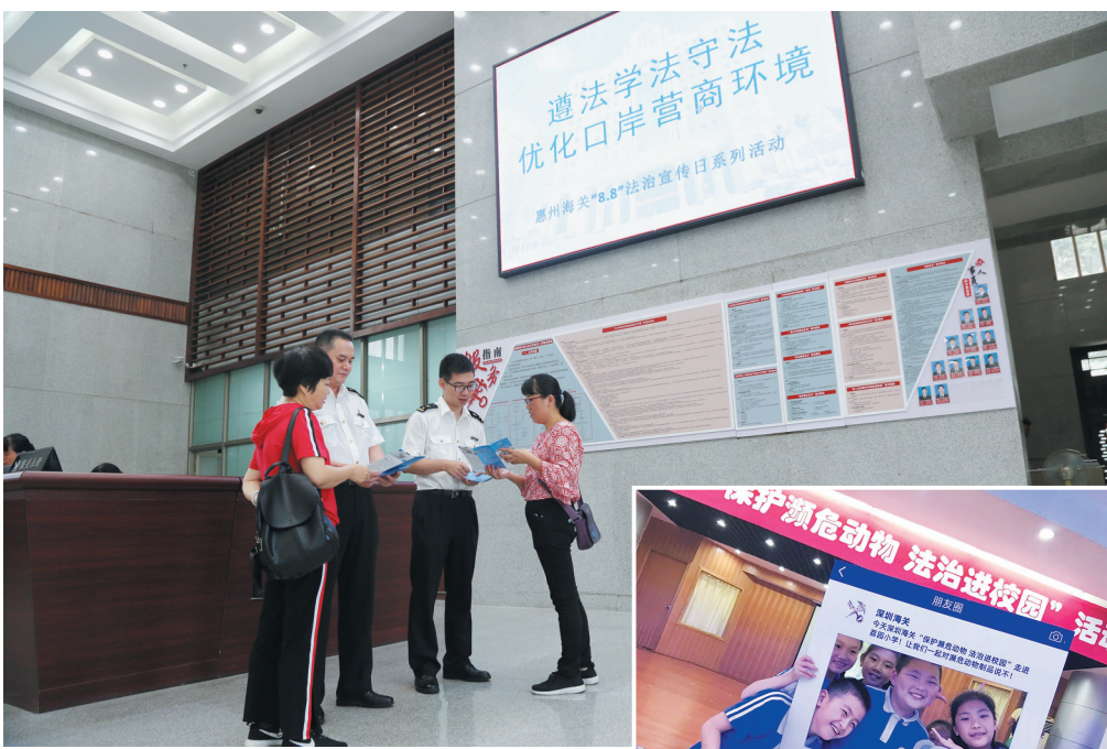
惠州海关关员在办事大厅向企业办事人员宣讲法规政策