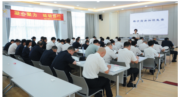
梅沙海关开展《公务员法》知识竞赛