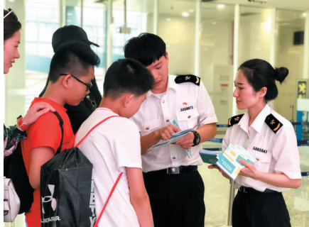
蛇口海关开展“8·8”海关法治宣传日活动