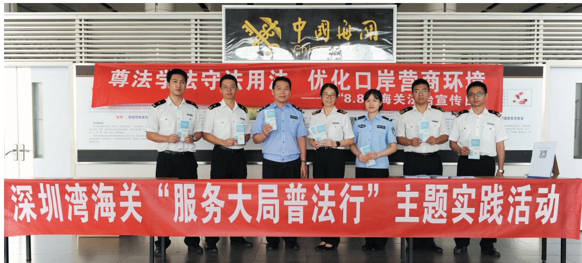
深圳湾海关开展“服务大局普法行”主题实践活动