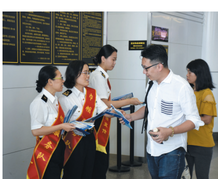
文锦渡海关关员在口岸向进出境旅客派发普法宣传折页