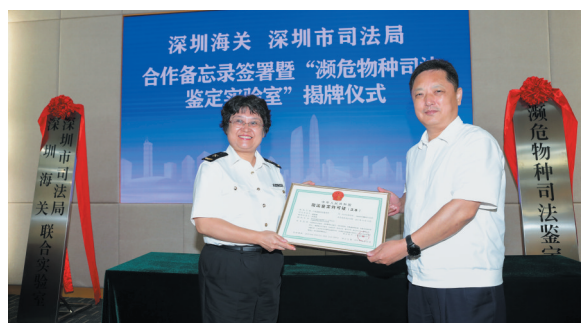
深圳海关与深圳市司法局共建濒危物种司法鉴定实验室